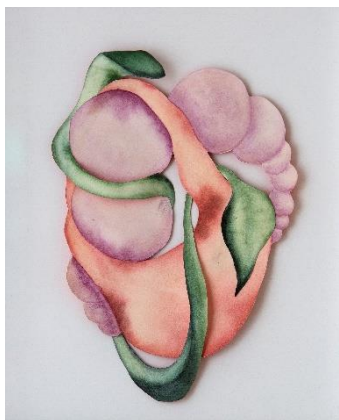
Série « In Vivo » 2023

On y retrouve notamment des peintures sur papier qualifiées de « paysages corporels », la série « In Vivo » composée de 7 œuvres en reliefs nées de la fusion de fragments organiques, épidermiques et végétaux et La série Membrane qui transporte le spectateur dans un univers où les frontières entre réalité et imaginaire s'estompent.