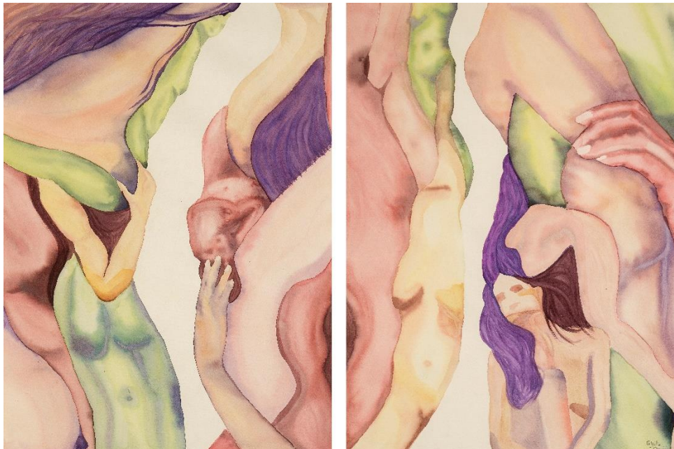
Sans titre 2023 Aquarelle sur papier 2 x 56 cm x 75 cm

Son travail questionne les liens subtils qui nous unissent les uns aux autres et au monde qui nous entoure, ainsi que les liens internes qui nous façonnent. La thématique de la fragmentation de l'identité humaine est également omniprésente dans son œuvre, revêtant une dimension à la fois psychologique, sociale et spirituelle. Au cœur de son exploration picturale, la Femme se dresse tel un emblème vibrant de l'énergie féminine. Elle nous invite à questionner notre équilibre intérieur et à restaurer l'harmonie délicate entre ces énergies yin et yang ; entre réceptivité et activité, douceur et force, intuition et logique.