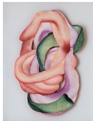
Aquarelle sur papier découpé 5 cm x 41 cm x 50 cm

L'exposition « Voyage Initiatique » se présente alors comme une invitation à célébrer l'élan vital qui nous anime, à méditer sur la complexité de notre existence, et à ressentir les vibrations de notre unique essence universelle.